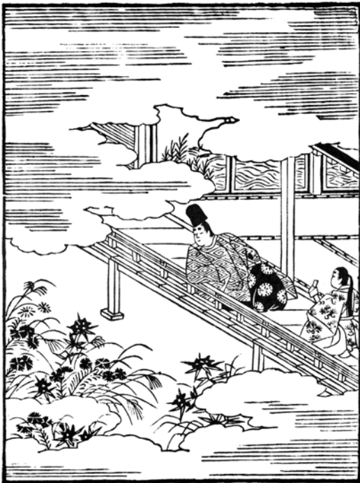
参考図版 3 (葵第五図)