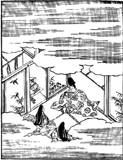
参考図版 1 (柏木第三図)