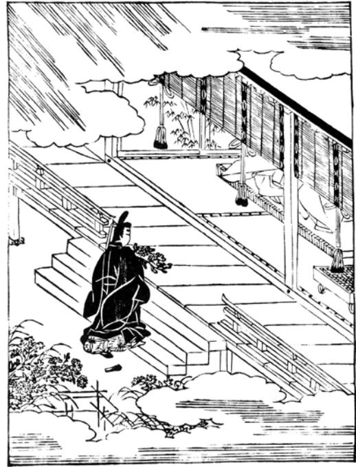
参考図版 2 (宿木第一図)