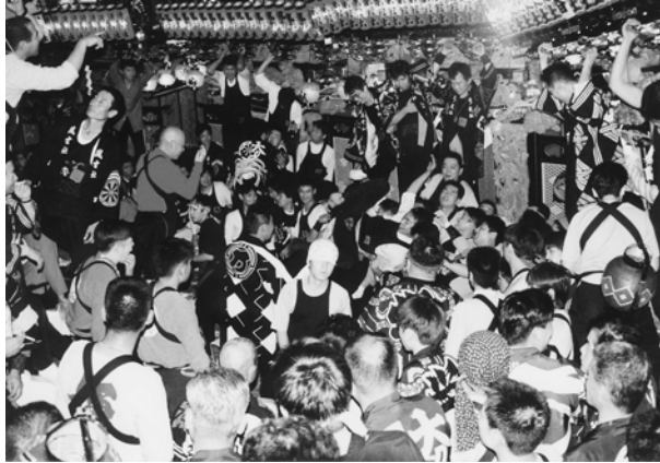
写真1 現在の練りの様子